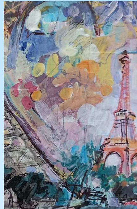
Tours Eiffel, Anne Vincent Goubeau, collection particulière